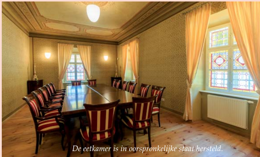
De eetkamer is in oorspronkelijke staat hersteld.

Die villa was tot nog toe in erbarmelijke staat. In 2014 begon men gelukkig, via een Norway Grant, aan de restauratie. Het resultaat is fantastisch. Alhoewel het gebouw vooral als bezinningsoord voor religieuzen wordt gebruikt, kan je er als bezoeker toch een kijkje nemen. Men heeft geprobeerd om