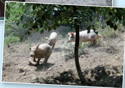
... en mijn varkens