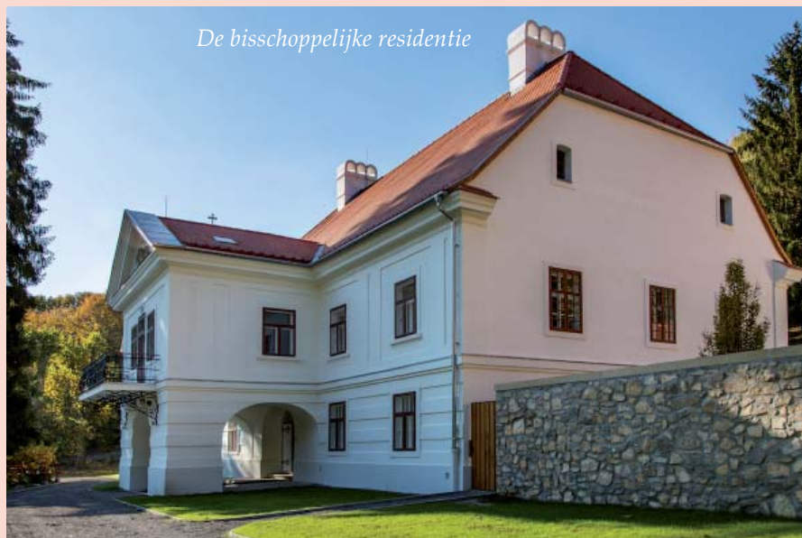
De bisschoppelijke residentie